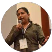
Leiria Vay Guatemala Drets mediambientals